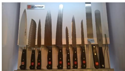
Los verkrijgbare messen